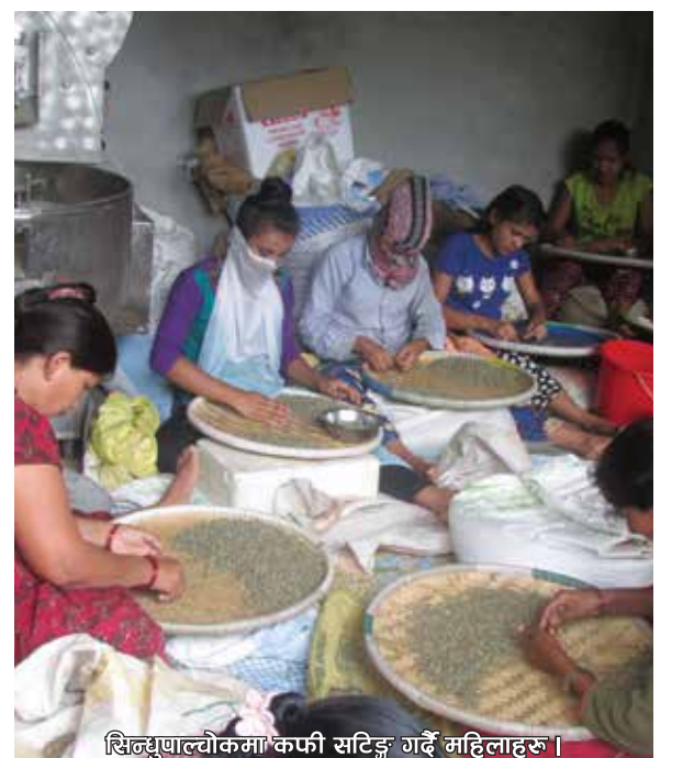
सिन्धुपाल्चोकमा कफी सटिङ्ग गर्दै महिलाहरू ।

चिया र कफी निर्यात गरौं, बैदेशिक मुद्रा आर्जन गरौं ।