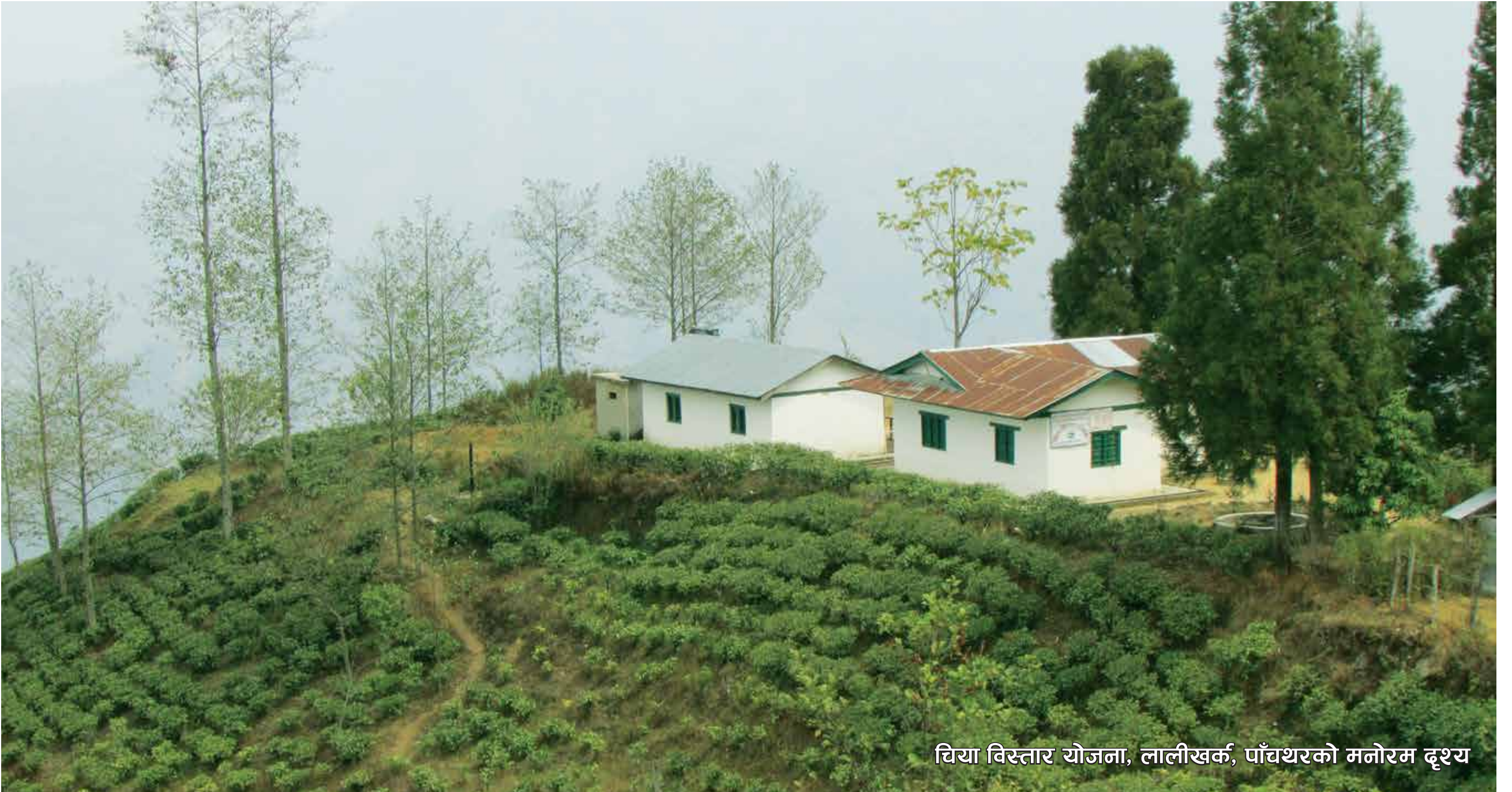
चिया विस्तार योजना, लालीखर्क, पाँचथरको मनोरम दृश्य

नयाँ बानेश्वर, काठमाडौं, फोन: ०१-४४९९७८६, ४४९५७९२, फ्याक्स नं. ०१-४४९७४९ E-mail: ntcdbboard@wlink.com.np, Website: www.teacoffee.gov.np