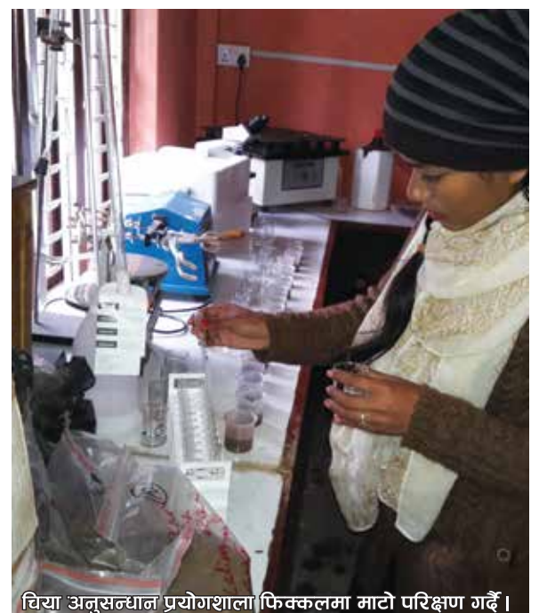
चिया अनुसन्धान प्रयोगशाला फिक्कलमा माटो परिक्षण गर्दै ।

चिया र कफी निर्यात गरौं, बैदेशिक मुद्रा आर्जन गरौं ।