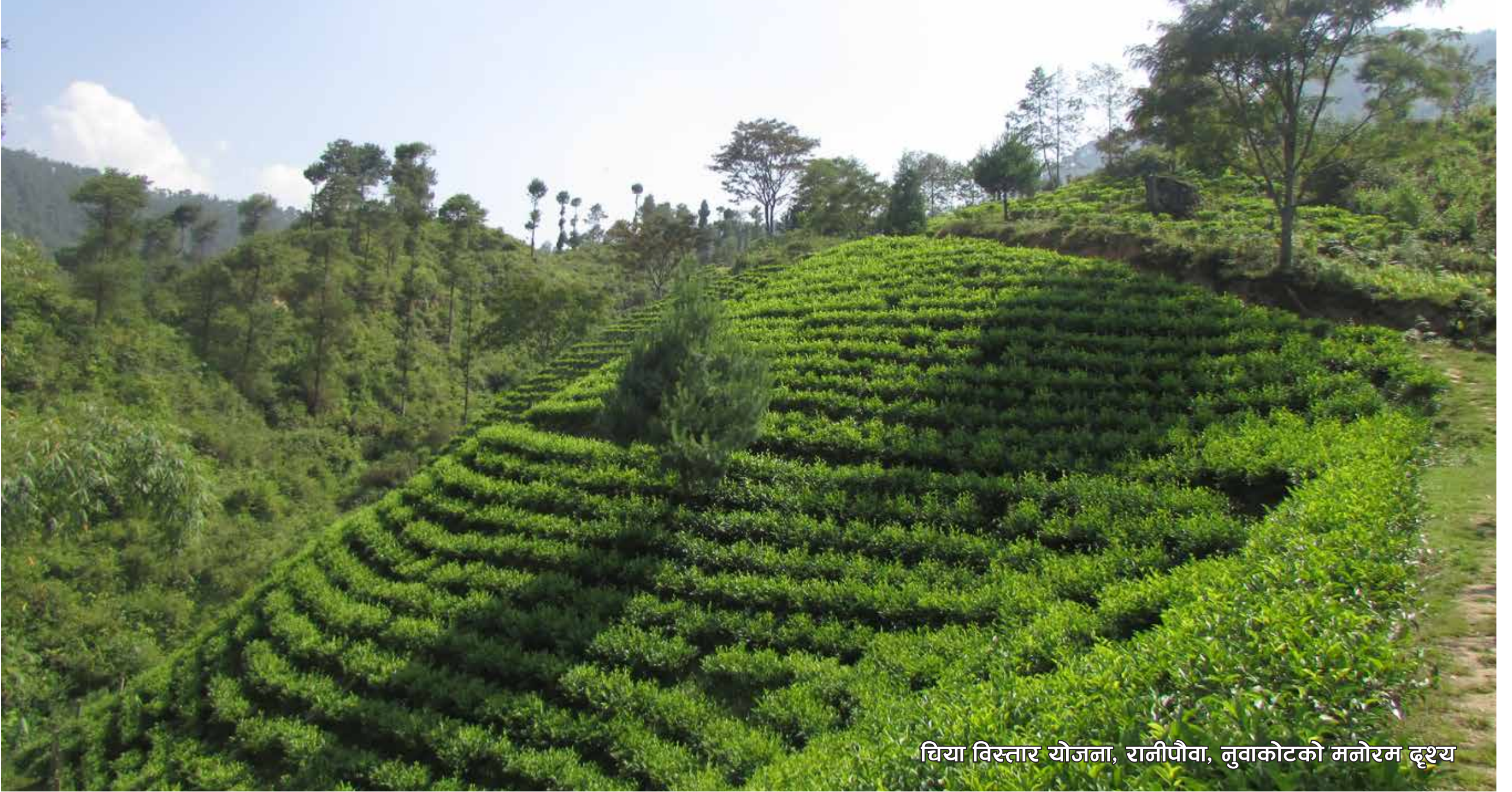
चिया विस्तार योजना, रानीपौवा, नुवाकोटको मनोरम दृश्य

नयाँ बानेश्वर, काठमाडौं, फोन: ०१-४४९९७८६, ४४९५७९२, फ्याक्स नं. ०१-४४९७४१ E-mail: ntcdbboard@wlink.com.np, Website: www.teacoffee.gov.np