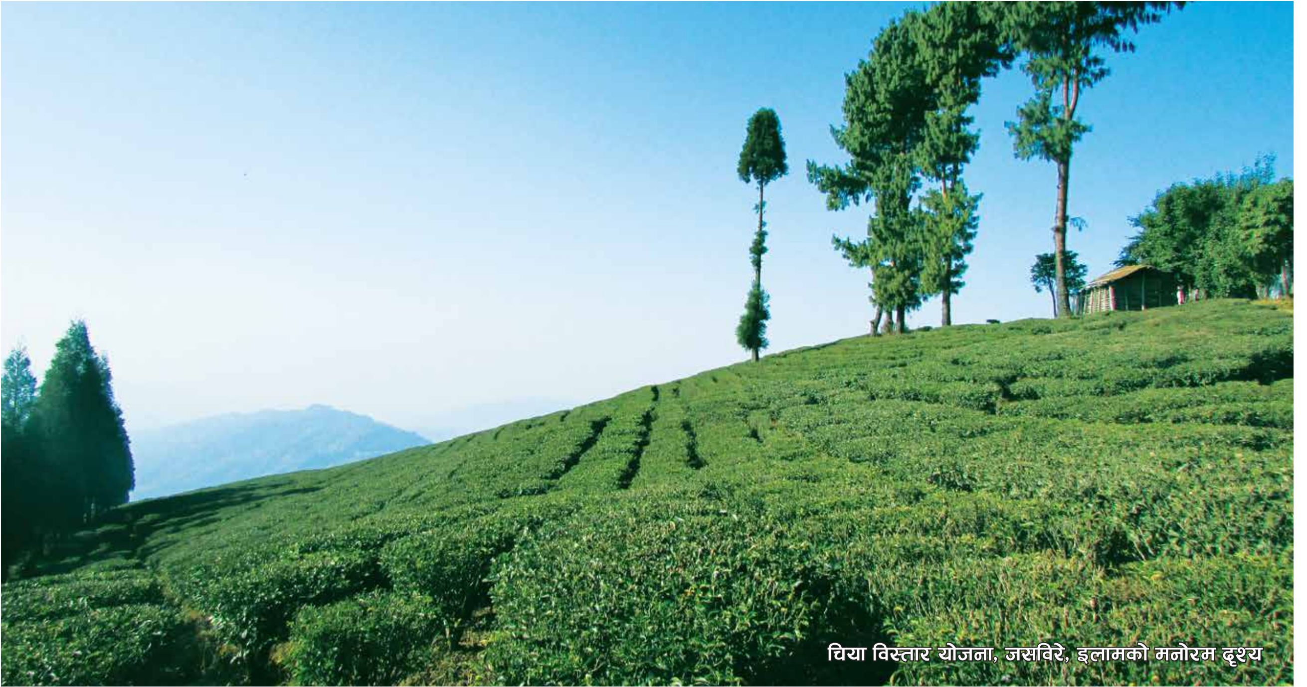
चिया विस्तार योजना, जसविरे, इलामको मनोरम दृश्य

नयाँ बानेश्वर, काठमाडौं, फोन: ०१-४४९९७८६, ४४९५७९२, फ्याक्स नं. ०१-४४९७४९ E-mail: ntcdbboard@wlink.com.np, Website: www.teacoffee.gov.np