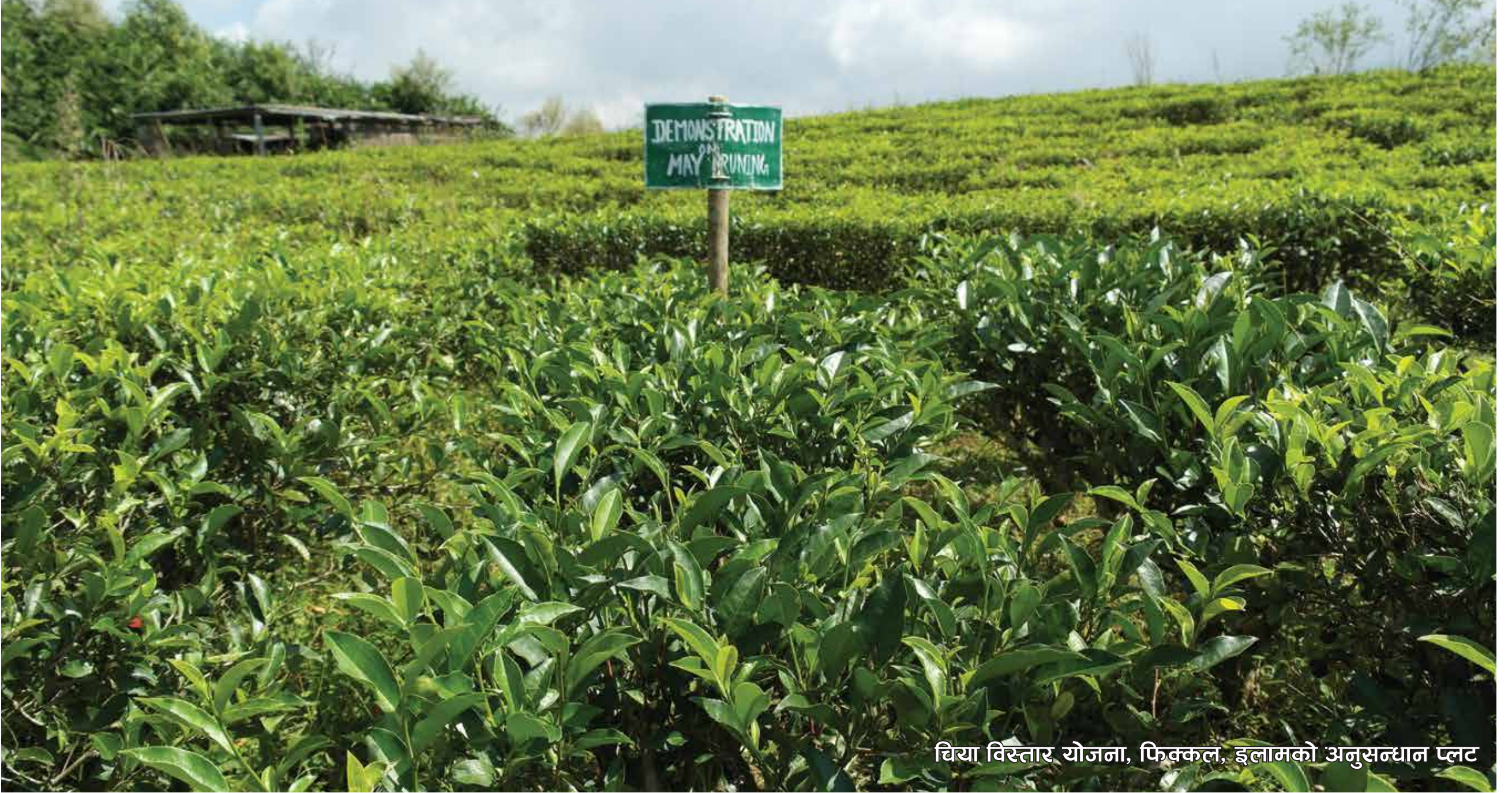
चिया विस्तार योजना, फिक्कला, इलामको अनुसन्धान प्लट

नयाँ बानेश्वर, काठमाडौं, फोन: ०१-४४९९७८६, ४४९५७९२, फ्याक्स नं. ०१-४४९७४९ E-mail: ntcdbboard@wlink.com.np, Website: www.teacoffee.gov.np