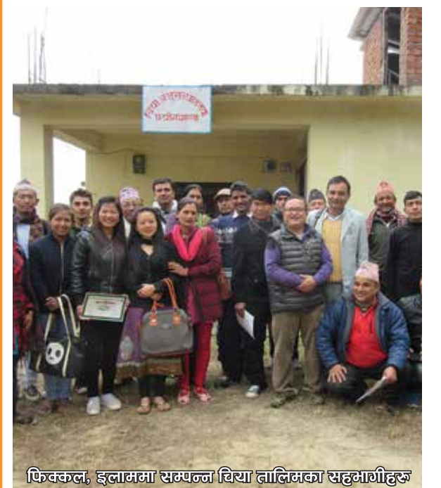
फिस्कल, इलाममा सम्पन्न चिया तालिमका सहभागीहरू

चिया र कफी निर्यात गरौं, बैदेशिक मुद्रा आर्जन गरौं।