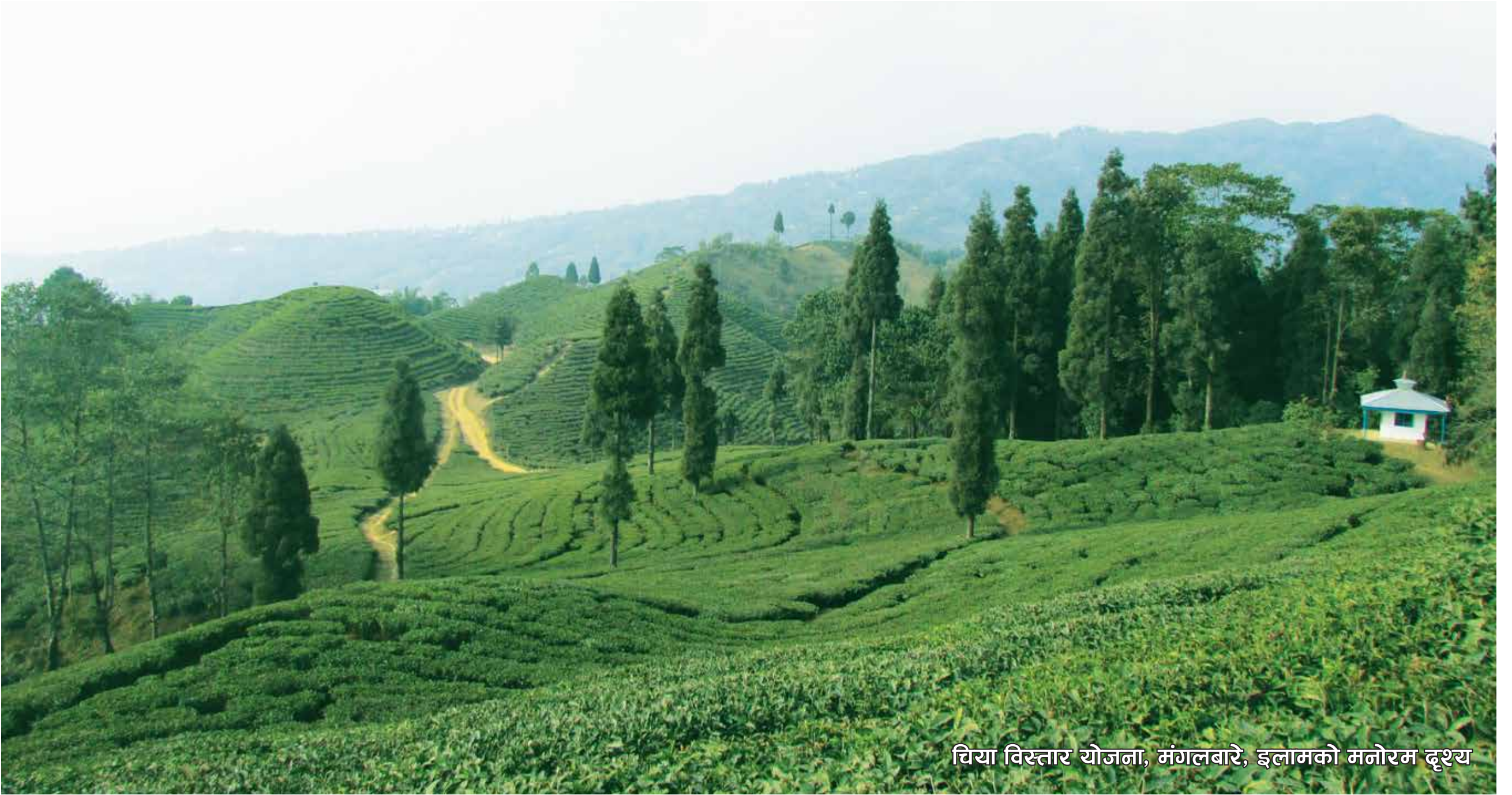
चिया विस्तार योजना, मंगलबारे, इलामको मनोरम दृश्य

नयाँ बानेश्वर, काठमाडौं, फोन: ०१-४४९९७८६, ४४९५७९२, फ्याक्स नं. ०१-४४९७४१ E-mail: ntcdbboard@wlink.com.np, Website: www.teacoffee.gov.np