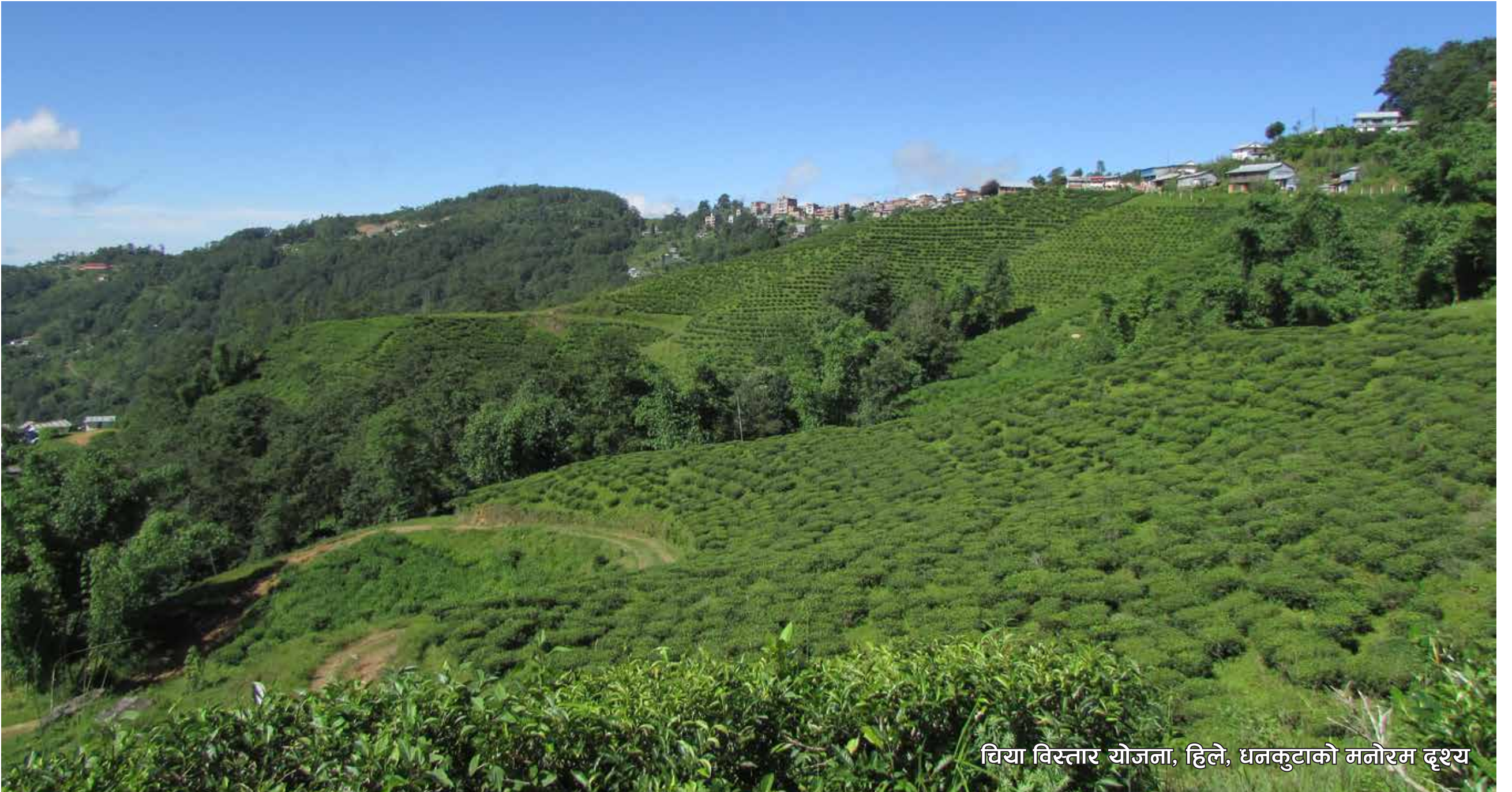
चिया विस्तार योजना, हिले, धनकुटाको मनोरम दृश्य

नयाँ बानेश्वर, काठमाडौं, फोन: ०१-४४९९७८६, ४४९५७९२, फ्याक्स नं. ०१-४४९७४१ E-mail: ntcdbboard@wlink.com.np, Website: www.teacoffee.gov.np