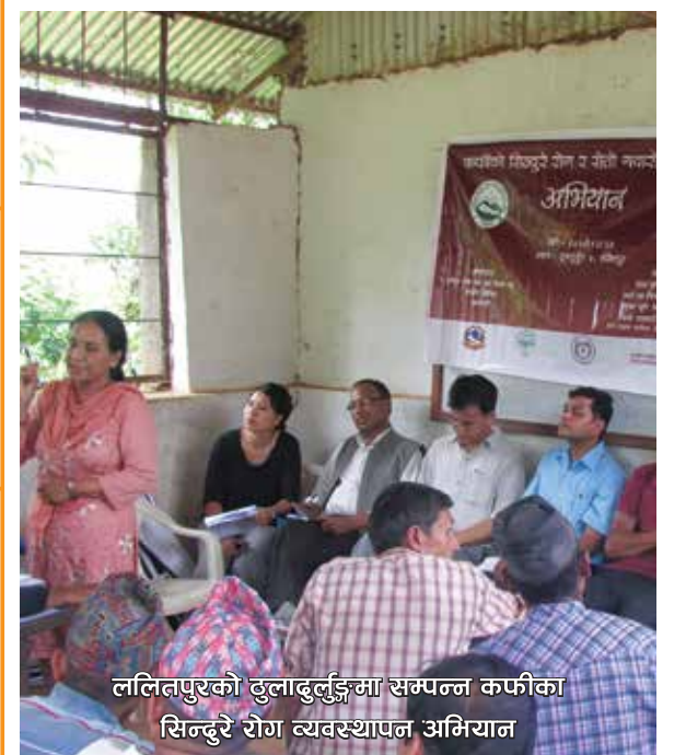
ललितपुरको तुलादुर्लुङ्गमा सम्पन्न कफीका सिन्दुरे रोग व्यवस्थापन अभियान

चिया र कफी निर्यात गरौं, बैदेशिक मुद्रा आर्जन गरौं।