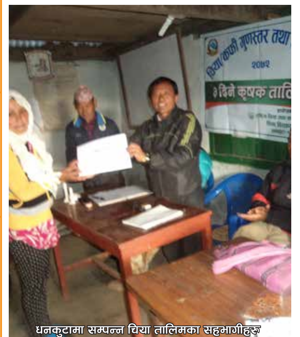
धनकुटामा सम्पन्न चिया तालिमका सहभागीहरू

चिया र कफी निर्यात गरौं, बैदेशिक मुद्रा आर्जन गरौं ।